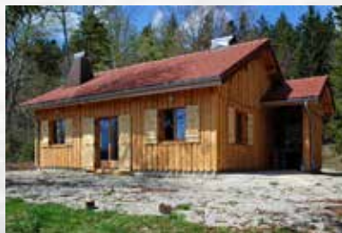
Chalet du Bief Plotet

Salle des fêtes : salle du colibri (bas) avec ou sans cuisine et vaisselle et/ou salle de la Renardière (haut). Possibilité de location de sono et écran.