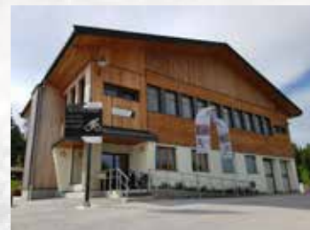
Salle de la Basse PRENOVEL