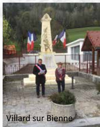
Villard sur Bienne